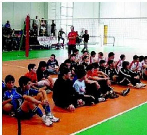
QUADRANGOLARE Quattro le formazioni in campo per il trofeo «Magagnini»

L'IMEP Volley Prato si è aggiudicata la dodicesima edizione del Trofeo "M. Magagnini", disputata come sempre a Calci, davanti ad un folto pubblico. Al mattino sono state giocate le semifinali. Nella prima i padroni di casa del Vbc Calci hanno battuto i Lupi S. Croce, giunti al torneo con una formazione sperimentale e in gran parte Under 13: 2-0 il risultato finale. A seguire sono scese in campo Prato e Invicta Grosseto: primo set appannaggio dei pratesi, secondo vinto dall'Invicta, grazie ad alcuni cambi operati dalla panchina grossetana. Il tie-break decisivo ha visto una supremazia targata Imep Volley e con il successo di questa formazione si è chiusa la secon-